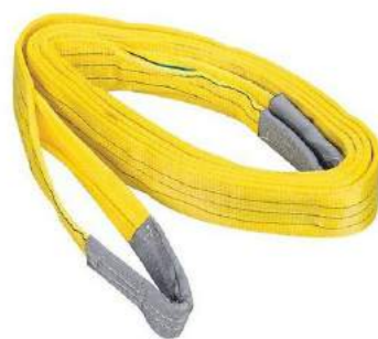
Hijsbanden en hijskettingen